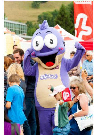
Mascotte Gloops, présente sur le stand de génération Pêche