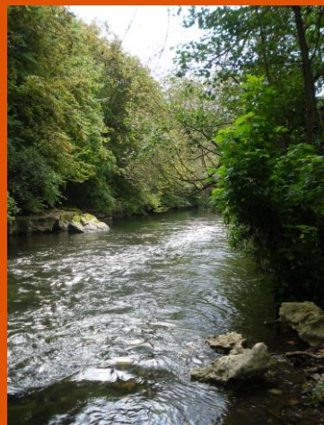
Figure 1 Parcours Découverte