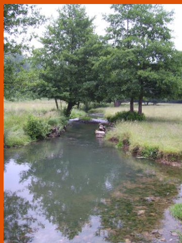
Figure 2 La Vendeline à Réchesy