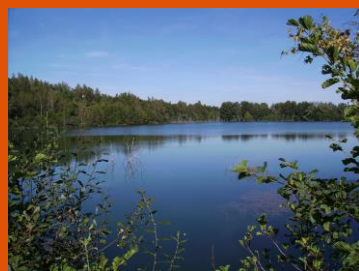
Figure 2 La Marnière à Fousse-magne