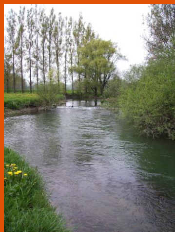
Figure 1 L'Allaine à Joncherey

Le parcours truite mis en place au printemps est une nouveauté attractive.